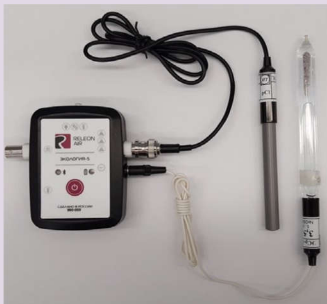
Рис. 10. Ионоселективный датчик (присоединены электро хлорид-ионов и электрод сравнения)

Датчик кислорода — предназначен для определения относительной концентрации кислорода в воздухе. Диапазон измерения: от 0 до 100 %. Разрешение: 0,1 %. Технологические особенности: при измерении содержания газа в выдыхаемом воздухе необходимо держать мембрану максимально близко ко рту; восстановление показаний на воздухе происходит через 1—2 минуты (время диффузии через мембрану).