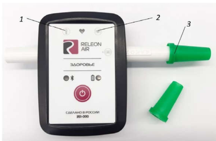
Рис. 3. Мультидатчик по физиологии. Обозначение разъемов и технологических отверстий: 1 — температура тела, 2 — пульс, 3 — частота дыхания (надет съёмный мундштук)

Мультидатчик по физиологии позволяет определять артериальное давление, пульс, температуру тела, частоту дыхания, ускорение движения (рис 3).