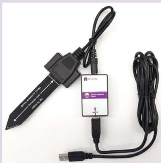
Рис. 4. Датчик влажности почвы

Датчик влажности почвы — предназначен для измерения степени увлажнения почвы, выраженной в процентах. Применяется в агроэкологических и сельскохозяйственных исследованиях.