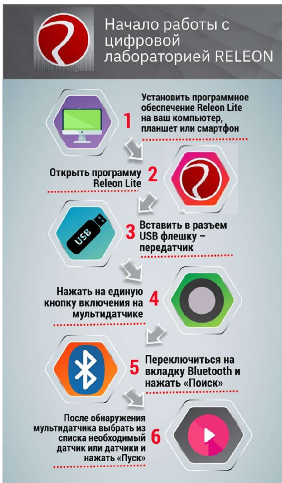
Рис. 14. Алгоритм работы с программным обеспечением Releon Lite

При изучении естественных наук в современной школе огромное значение имеет наглядность учебного материала. Наглядность даёт возможность быстрее и глубже усваивать изучаемую тему, помогает разобраться в трудных для восприятия вопросах, и повышает интерес к предмету.