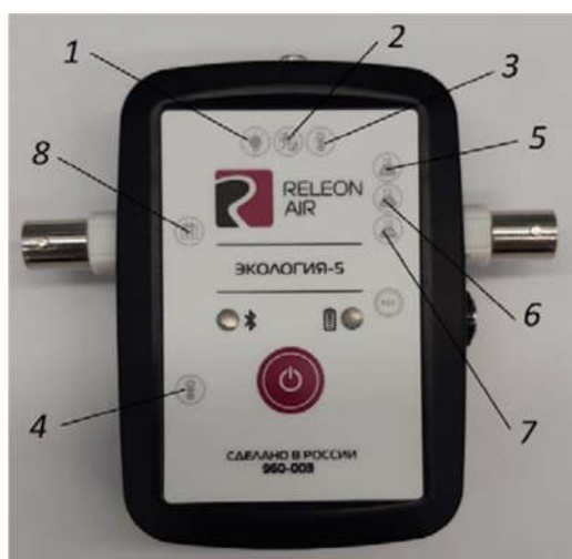
Рис. 2. Мультидатчик по экологии. Обозначение разъемов и технологических отверстий: 1 — освещённость, 2 — относительная влажность воздуха, 3 — температура окружающей среды, 4 — температура растворов, 5 — нитрат-ионы, 6 — хлорид-ионы, 7 — pH, 8 — электропроводность

Мультидатчик по экологии позволяет измерять следующие показатели: водородный показатель водных сред, концентрации нитрат-ионов и хлорид-ионов, электропроводность, влажность, освещённость, температуру окружающей среды, температуру растворов, растворов и твёрдых тел ( рис. 2 ).