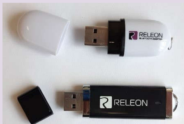
Рис. 13. Общий вид USB-флеш-накопителя (внизу) и Bluetooth-адаптера (вверху) Releon

В комплекте цифровой лаборатории Releon поставляется программное обеспечение Releon Lite на USB-флеш-накопителе, а также Bluetooth-адаптер для связи регистратора данных с беспроводными датчиками (рис. 13).