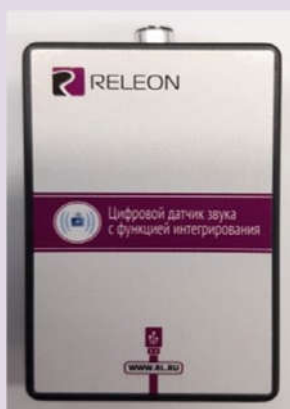
Рис. 7. Датчик звука

Датчик температуры термопарный предназначен для измерения температур до 900. Используется при выполнении работ, связанных с измерением температур плавления и разложения веществ, а также для измерения температуры в экзотермических процессах. Датчик звука — измеряет уровень шумов в окружающей среде и при оценке шумопоглощающих изоляторов. Динамический диапазон: от 30 до 130 дБ. Частотный диапазон: от 50 Гц до 8 кГц. Разрешение: 0,1 дБА (акустические децибелы). Технологические особенности: датчик чувствителен к резким звукам, которые могут дать завышенные результаты измерений.