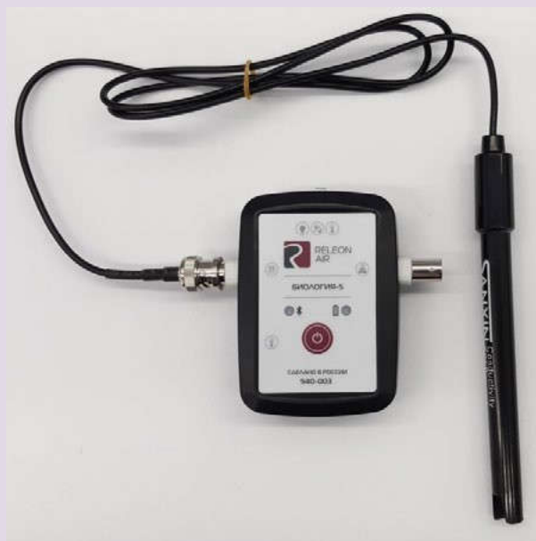
Рис. 5. Датчики электропроводности

Датчик электропроводности — предназначен для регистрации и измерения удельной электропроводности жидких сред, в том числе и водных растворов веществ. Применяется при изучении характеристик водных растворов, в том числе почвенных вытяжек.