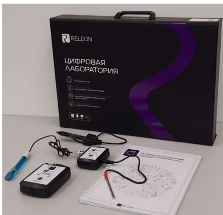
Рис. 1. Цифровая лаборатория

Ниже дана краткая характеристика цифровых датчиков, приведены выявленные на практике технологические особенности применения. Учёт этих особенностей позволит правильно использовать датчики и продлить срок их службы.