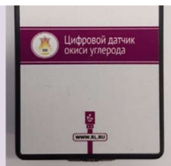
Рис. 11. Датчики кислорода (слева) и угарного газа (справа)