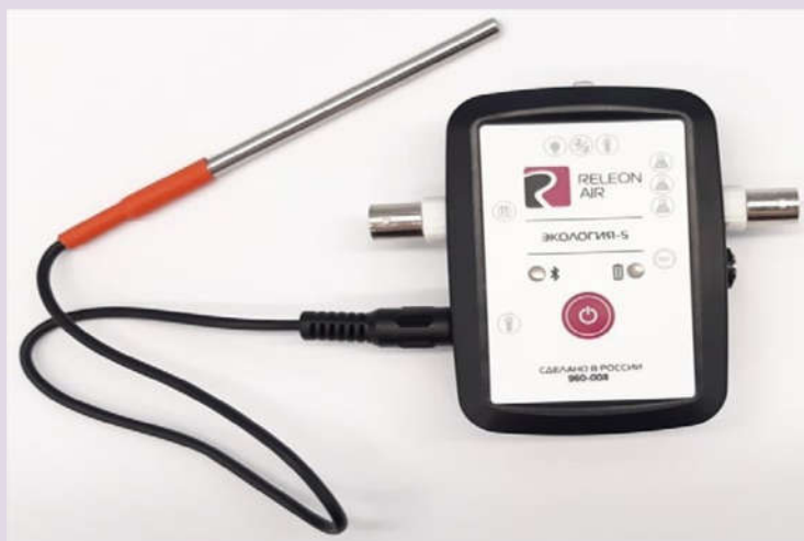
Рис. 6. Датчик температуры растворов

Датчик температуры термопарный предназначен для измерения температур до 900. Используется при выполнении работ, связанных с измерением температур плавления и разложения веществ, а также для измерения температуры в экзотермических процессах. Датчик звука — измеряет уровень шумов в окружающей среде и при оценке шумопоглощающих изоляторов. Динамический диапазон: от 30 до 130 дБ. Частотный диапазон: от 50 Гц до 8 кГц. Разрешение: 0,1 дБА (акустические децибелы). Технологические особенности: датчик чувствителен к резким звукам, которые могут дать завышенные результаты измерений.