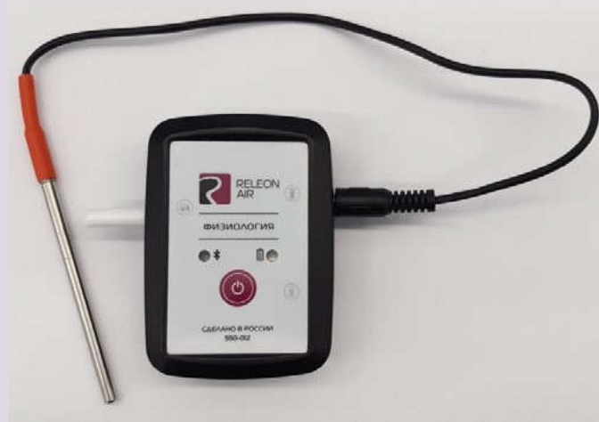
Рис. 12. Датчик температуры тела

Датчик температуры тела — предназначен для непрерывного измерения температуры тела в подмышечной впадине. Оснащён выносным зондом. Диапазон измерения: от 25 до 50 °С. Разрешение датчика: 0,1 °С. Технологическая особенность: для точного измерения в подмышечной впадине должна находиться вся металлическая часть зонда.